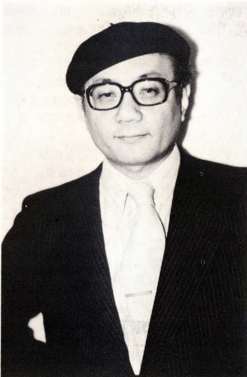
久し振りにプラネタリウムの姿を見て、思わず抱きしめたくなったという手塚治虫氏

プラネタリウムのホールを囲む廊下の壁には、星団や渦状星雲や、プロミネンスやコロナの写真が並べて飾ってあり、その当時にはそれだけの数の天体写真が一堂にあるというだけで驚異だった。ホールへは行った時の印象は強烈だった。あの鉄垂鈴の奇怪な姿は目に焼きついて、後年漫画の仕事の上でも、しばしばイメージを流用させて貰ったくらいである。今考えると、あのデザインはたしかにライカやコンタックスの新型カメラに通じるかっこよさで、ナチスドイツの光学技術の粋であった。