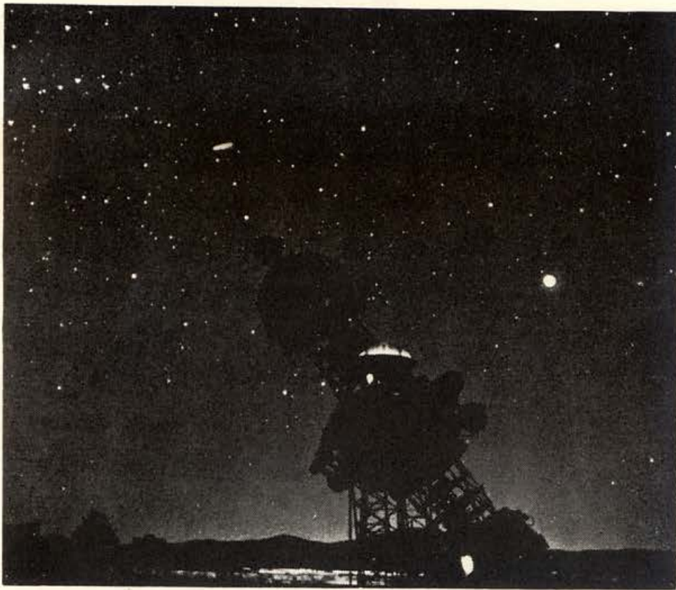
健在のプラネタリウムと今は撤去した展望シルエット

はてっきりプラネタリウムのための曲だと思い込んでいたのである。この曲がかかるだけで たちま 忽ち神秘的な宇宙空間的な気分 たちま に酔うのだった。視聴覚イメージの効果はおそろしい。